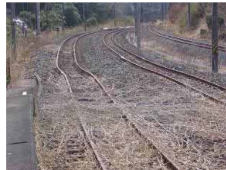
桃内駅構内 軌道変位