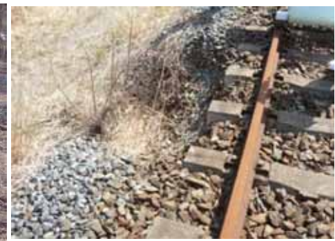
桃内～小高間 道床碎石流出