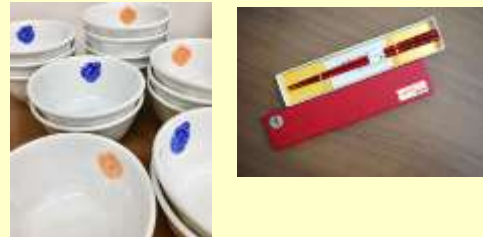
村上どんぶり合戦 賞品 「ロゴ入りのミニどんぶり」 村上観光ラリー 賞品 「村上木彫堆朱」の箸