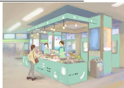
改札前美化装飾(イメージ)

新潟県・庄内エリア DC のキャッチフレーズ「日本海美食旅」を意識したエリアの食材や、雪・花火等の季節性のあるアイコンを用い、統一空間を演出します。