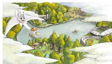
新潟ストーリープロジェクトの紹介(イメージ)

新潟ストーリープロジェクトの紹介および、新潟在住のフォトグラファー撮影の写真を編集した地域紹介パネルの展示。またレンタサイクルを用意し、写真で気になった場所に思わずショートトリップをしたくなるような仕掛けを用意する。