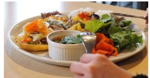
ローカルフード販売

地域の食文化を大切にするローカルフードレストランやカフェが出店し、食と人と街に出会うきっかけをつくる。