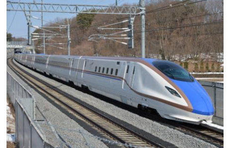
E7系 (かがやき・はくたか等)