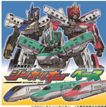
新幹線変形ロボ シンカリオン

「新幹線変形ロボ シンカリオン」が新潟新幹線車両センターにやってきます。各ゲームに参加してオリジナルグッズを手に入れたり、一緒に記念撮影もお楽しみいただけます。