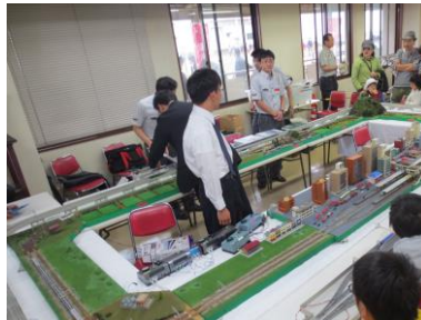
鉄道模型 (Nゲージ) 展示