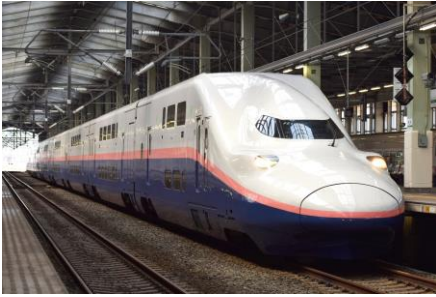
E4系 (Max とき)

普段新潟では見ることができないE6系・E7系、そして新潟ではおなじみのMax2階建てE4系車両を展示します。