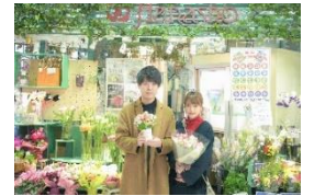
フラワーバレンタイン（イメージ）