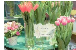
花きの販売 (イメージ)