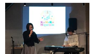
音楽ライブ（イメージ）