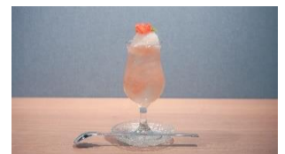
花咲くクリームソーダ （イメージ）