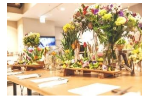
花の撮影オブジェ (イメージ)