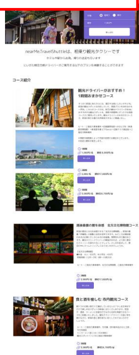
予約WEBサイトイメージ