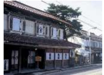
喜多方フリー観光「街並み」