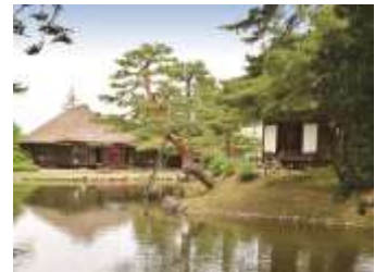
会津若松フリー観光「御薬園」

びゅう商品のお申込みは、「びゅうプラザ新潟駅」・「びゅうプラザ長岡駅」で承ります。