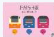
〈景品一例〉 オリジナルステッカー

※回答用紙・景品の数量には限りがあります。予定数量に達した場合、終了予定時間前であっても、配布・景品引換を終了いたします。