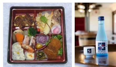
左)ほろよいおつまみセット(昨年度) 右)Shu*Kuraオリジナル大吟醸