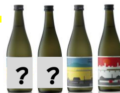
2017年度 新潟しゅぽっぽ

12月15日(金) 吉乃川、君の井酒造 12月16日(土) 今代司酒造、越後鶴亀