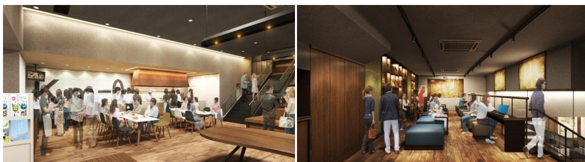
Km-0 NIIGATA LAB イメージパース

新潟市と東日本旅客鉄道株式会社新潟支社とともに本施設を多方面から応援することで、より一層の地域活性化に努めて参ります。