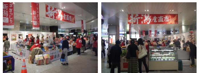
前回の大会場での新潟産直市の様子

※磨き屋一番館とは 金属加工産業の基盤技術である金属研磨業に携わる後継者の育成 新規開業者の促進、技術の高度化による産地産業の振興および体験 学習による金属研磨技術の普及を図ることを目的に建設された施設です。