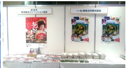
観光 PR (ポスター&パンフレット)