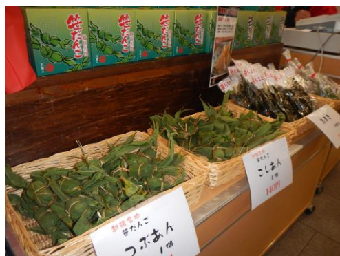
新潟を代表する銘菓「笹団子」販売