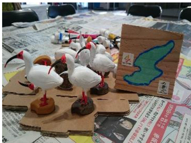
【トキデコイ色づけ体験】

天然記念物「朱鷺」の置物に色を付ける体験です。箱に入れてお持ち帰りいただけます。