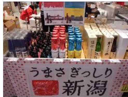
地酒王国新潟の日本酒販売