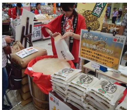
お米の量り売り販売