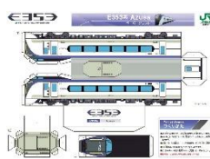
【ペーパークラフトイメージ】