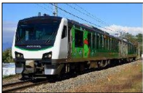
【リゾートビューふるさと】

http://www.jreast.co.jp/nagano/highrail/