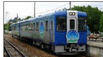
【HIGH RAIL 1375】