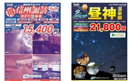
パンフレットイメージ