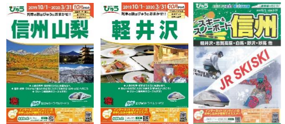
パンフレットイメージ