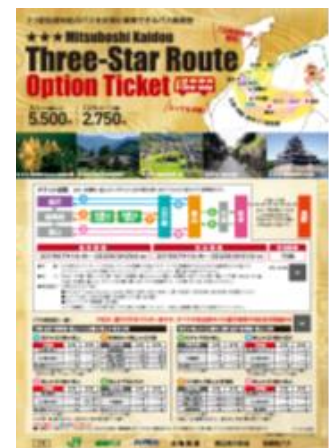
専用パンフレット