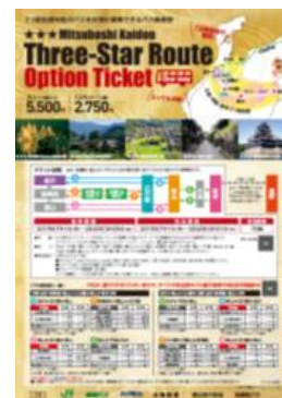
専用パンフレット