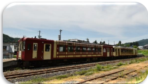
(「おいこっと」イメージ)

車内は、子供のころ夏休みに遊びに行っていたおばあちゃんの家のような、懐かしさ、楽しさを感じさせる「古民家」を意識したデザインとなっており、茅葺屋根の民家のふすまや障子などをイメージした外観デザインや、唱歌「故郷」に登場する「うさぎ」などをアイコン化しています。