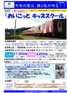
(「パンフレット」イメージ)