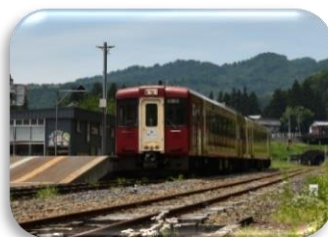
(「おいこっと」イメージ)