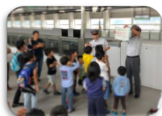
(「駅のバックヤード見学」イメージ)