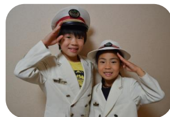
(「駅長制服」イメージ)