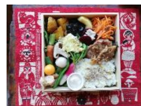
〔冬の山野の恵みランチ〕

http://view-web-magazine.eki-net.biz/nagano/A8410/#page=1