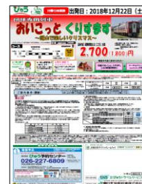
〔パンフレット〕 〔おいこっと くりすます〕

(3) 「リゾートビューふるさと」においてクリスマス企画のおもてなしを実施します。