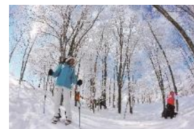
〔スノーアクティビティ〕

http://view-web-magazine.eki-net.biz/nagano/A8409/#page=1