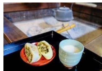
〔ふるまいのイメージ〕