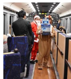
〔昨年のおもてなしの様子〕

(2) 団体臨時列車「おいこっと くりすます」においてクリスマス企画のおもてなしを実施します。