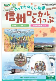
〔信州ローカルとりっぷパンフレット〕 〔おいこっと/リゾートビューふるさと〕