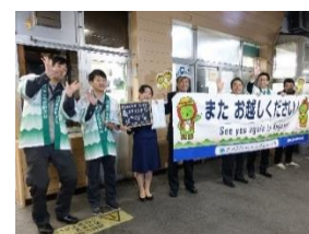
〔昨年のおもてなしの様子〕