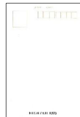
〔ちょっぴりプレゼント（ポストカード）〕