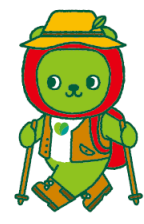
長野県 PR キャラクター「アルクマ」 ©長野県アルクマ