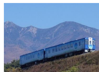
【HIGH RAIL 1375】