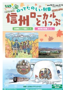
〔信州ローカルとりっぶパンフレット〕 (おいこつと/リゾートビューふるさと)