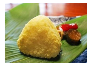
[きなこおむすび]