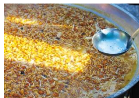
[きのこ汁]