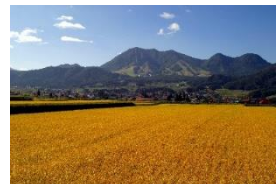
[木島平米]