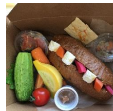
〔佐久の大地の花束ランチ〕

http://view-web-magazine.eki-net.biz/nagano/A8410/#page=1