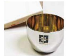
コースの一例 (越乃Shu*Kuraオリジナルお猪口)