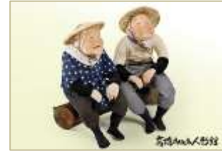
高橋まゆみ人形館