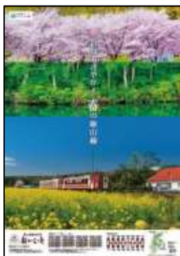
[ポスターイメージ]