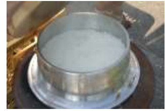
民宿での釜炊き体験

地元の澄んだ水を使い、薪で地元のお米を炊く「釜炊き体験」をお楽しみいただきます。昼食では地元の山菜などを使った天ぷらなどをおかずにご自身で炊いたご飯をお召し上がりいただくコースです。