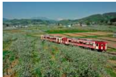
「おいこっと」イメージ

※全車指定席で運転いたします。指定席券のないお客さまはご利用いただくことはできません。