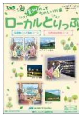
[旅行商品パンフレットイメージ]