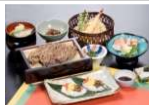
斑尾高原ホテルでの食事

(春) 山の恵み 山菜採りと信州蕎麦 (飯山駅から送迎あり) 春の息吹を感じられる「山菜」を自らの手で採り、昼食では信州蕎麦をお楽しみいただくコースです。