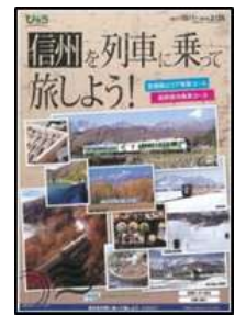
[パンフレットイメージ]