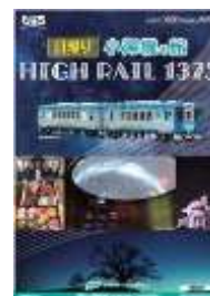
[パンフレットイメージ]

当社長野支社ホームページ： http://www.jreast.co.jp/nagano/