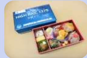
星空 特製弁当(イメージ)

小淵沢駅～佐久平駅（小諸駅）間の乗車券・座席指定券と「星空特製弁当」をセットにした商品です。 HIGH RAIL 星空をイメージしたパッケージでお届けする特製弁当をお楽しみください。