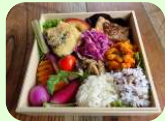
冬の山野の恵みランチ(イメージ)

佐久平駅（小諸駅）～小淵沢駅間の乗車券・座席指定券と「冬の山野の恵みランチ」をセットにした商品です。 小海線沿線で農薬や化学肥料を使わずに育てられた野菜を使ったHIGH RAIL 1375 オリジナルの「ランチ」です。