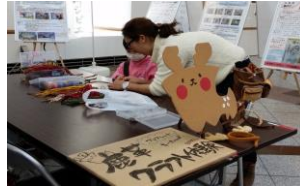
【鹿革クラフト体験(有料)】