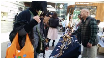
【鹿革・鹿角製品の販売】