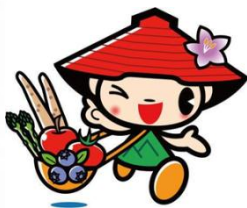
山形村イメージ キャラクター 「やまっち」

長野県観光PRキャラクター「アルクマ」と山形村イメージキャラクター「やまっち」が松本駅の到着ホームで皆さまをお迎えします。