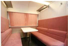
2・3・5号車のイメージ

先頭・後尾車両となる1・6号車はゆっくりくつろげる回転リクライニングシートを装備するとともに、定員が1車両あたり29名とゆったりとした空間が広がります。