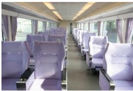
1・6号車のイメージ

「いろいろ号」とは、信州の色鮮やかな四季や自然をモチーフに、2007年にデビューした6両編成の列車です。