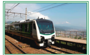
(リゾートビューふるさと)

※びゅう旅行商品・企画乗車券「ナイトビュー姨捨往復きっぷ」の詳しい情報につきましては後日掲載いたします。