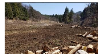
駅近くにある漆畑