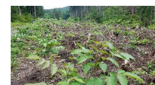
成長中の漆の苗木