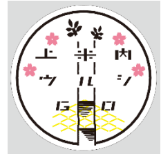
ヘッドマークイメージ

クラウドファンディングの一日駅長体験コースにご支援くださった支援者様に、上米内駅一日駅長を委嘱いたします。臨時列車の出発式や、列車到着時のお出迎え等の業務をご体験いただけます。