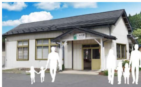
駅舎外装イメージ