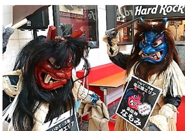
小正月伝統行事「なもみ」