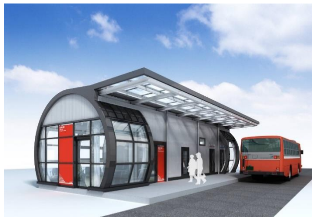
南気仙沼駅イメージ