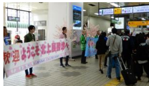
歓迎キャンペーン（イメージ）