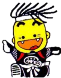
北上市観光キャラクターおに丸くん