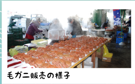
毛ガニ販売の様子