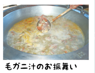
毛ガニ汁のお振舞い