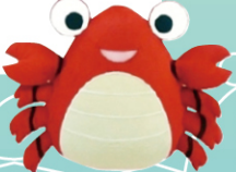
宮古毛ガニ祭りのキャラクター「毛ガニ君」