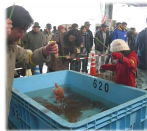
宮古毛ガニ祭り(イメージ)