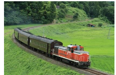
旧型客車 (イメージ)