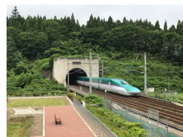
青函トンネル入口 (イメージ)