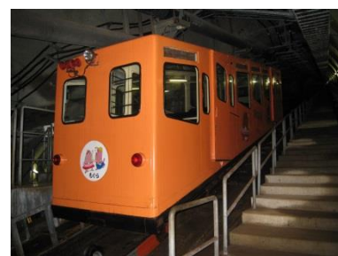
青函トンネル記念館 (イメージ)