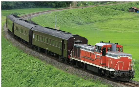
津軽線レトロ客車号(イメージ)