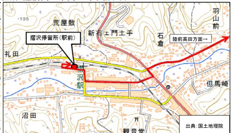
住所:一関市大東町摺沢字街道下