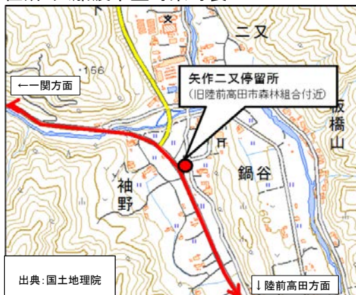
住所:陸前高田市矢作町字袖野