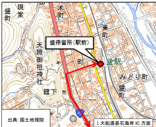
住所:大船渡市盛町東町裏