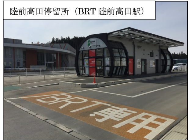
陸前高田停留所（BRT 陸前高田駅）