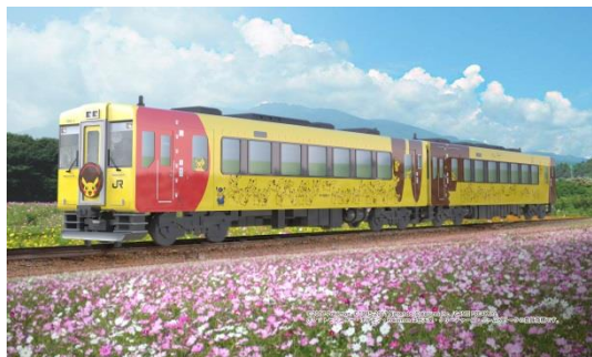
【エクステリアデザイン】