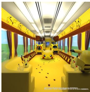
【プレイルーム車両】