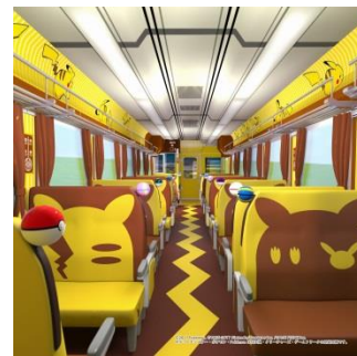
【コミュニケーションシート車両】