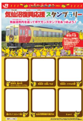
【スタンプラリー台紙】

各スタンプ設置箇所のスタンプデザインと景品のペーパークラフトのデザインを新しい車両イメージに合わせて変更いたしました。