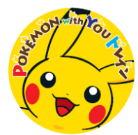
【缶バッジ (上り列車用)】