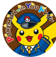
【缶バッジ (下り列車用)】