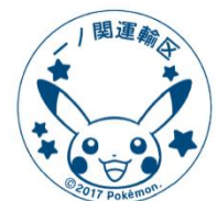
【スタンプ印影 (イメージ)】

車掌が車内改札で使用する改札用スタンプを「POKÉMON with YOUトレイン」限定で用意し、指定席券にスタンプを押印いたします。