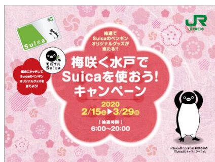
▲キャンペーン端末画面(イメージ)