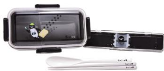
▲A 賞 ランチボックス(10 名さま)