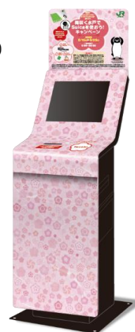
▲キャンペーン端末(イメージ)