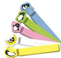
▲C 賞 フードクリップ(460 名さま) ※色は選べません。