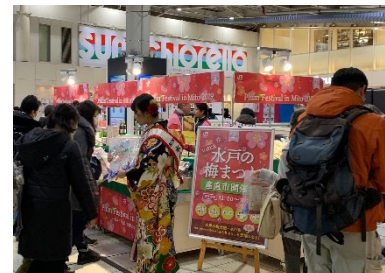
【水戸の梅大使による観光PR】