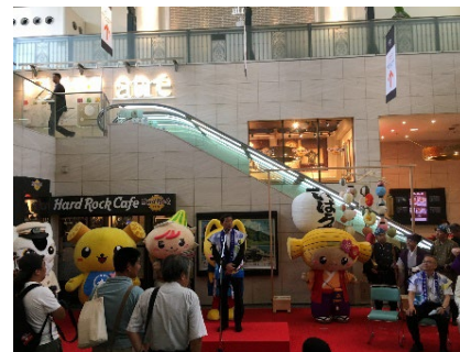
【イベントステージ】