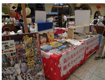
【観光 PR ブース】