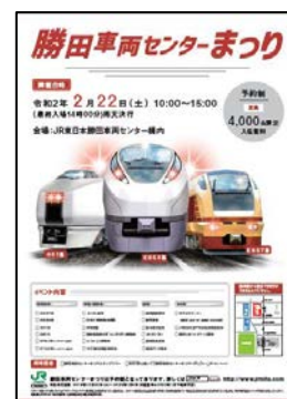
【ポスター イメージ】

※お申込み方法等の情報は、 JRみと検索 または、 www.jrmito.com