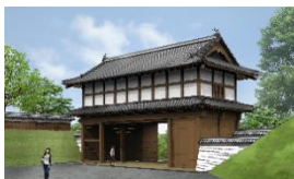
【水戸城大手門(イメージ)】

「徳川光圀公が寄贈したといわれる極小仏像(約1.5cm)」が今秋に続き、期間限定で公開されます。