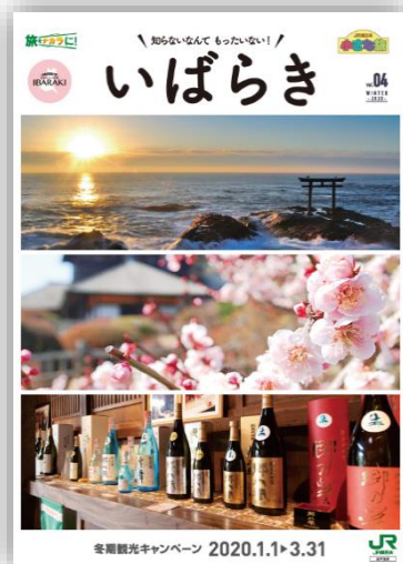
【小さな旅 パンフレット】