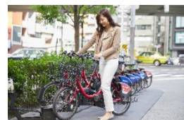
【シェアサイクル(イメージ)】