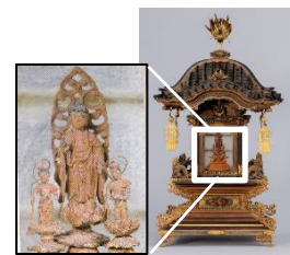
【厨子入阿弥陀三尊像】