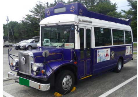
【地域再発見バス】イメージ