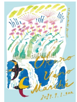
【ポスターイメージ】