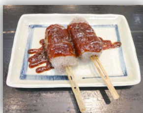
【柚子味噌冷やし田楽】