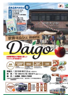
【ポスターイメージ】