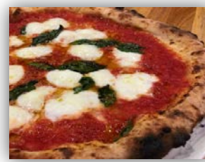
【マルゲリータサンド】