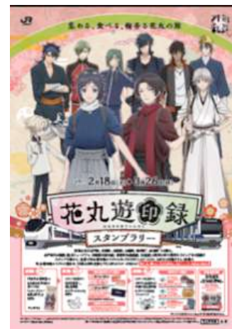
〔ポスターイメージ〕