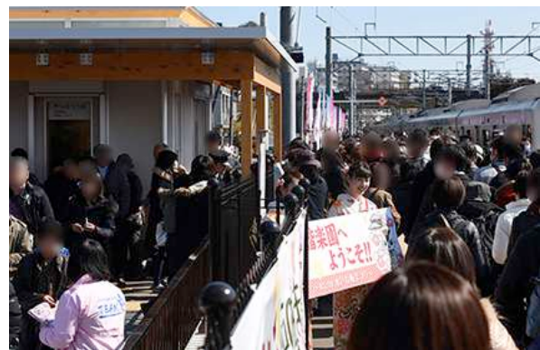
〔水戸の梅大使によるお出迎え〕