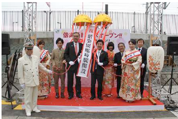
〔偕楽園臨時駅オープニングセレモニー〕

臨時駅開設初日の2月18日(土)には、臨時駅の開設と梅まつりの開幕を記念して、オープニングセレモニーを行いました。また、開設期間中は、「水戸の梅大使」によるお出迎えを行いました。