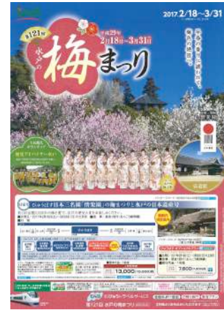
〔パンフレットイメージ〕