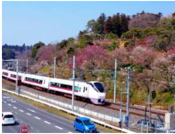
〔偕楽園とひたち号(3月20日)〕

梅まつり期間にあわせて「第 121 回水戸の梅まつり」旅行商品を設定し、1,110 名(対前年 134%)のお客さまにご参加いただきました。