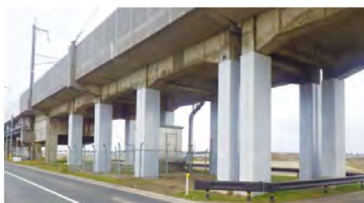
高架橋柱耐震補強