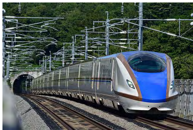
プロジェクト 01 車両 (新幹線 E7 系)