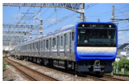
図-1 E235 系車両外観

DNV は、本プロジェクトに全額新規充当され、プロジェクトは順調に進捗していることを確認しました。