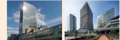
【JR新宿ミライナタワー】JR SHINJUKU MIRAINA TOWER 【ウォーターズ竹芝】WATERS takeshiba

賃貸可能物件 47棟 (うち東京圏 46棟) Leased properties: 47 properties (46 in the Tokyo area) 賃貸可能面積 約56万㎡ (うち東京圏 約54万㎡) Leased floor space: Approx. 560 thousand m 2 (Approx. 540 thousand m 2 in the Tokyo area)