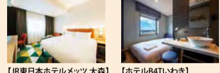
【JR東日本ホテルメッツ 大森】JR-EAST HOTEL METS OMORI 【HOTEL B4T いわき】HOTEL B4T IWAKI JR-EAST