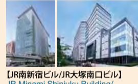
【JR南新宿ビル/JR大塚南口ビル】JR Minami Shinjuku Building / JR Otsuka Minamiguchi Building