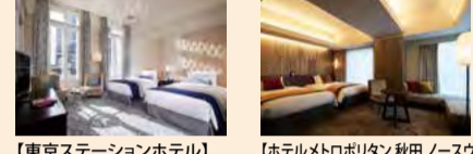
【東京ステーションホテル】THE TOKYO STATION HOTEL 【ホテルメトロポリタン秋田 ノースウィング】HOTEL METROPOLITAN AKITA North Wing annex

主なブランド Main brands メトロポリタンホテルズ 14ホテル 4,146室 METROPOLITAN HOTELS: 14 hotels, 4,146 rooms JR東日本ホテルメッツ 29ホテル 4,110室 JR-EAST HOTEL METS: 29 hotels, 4,110 rooms HOTEL B4T 1ホテル 227室 HOTEL B4T JR-EAST: 1 hotel, 227 rooms ハイクラス・リゾート等 14ホテル 1,210室 High-end/resort hotels: 14 hotels, 1,210 rooms