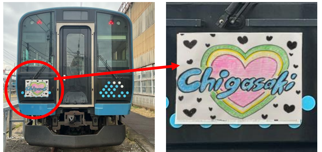
参加者が制作した絵をヘッドマークとして掲出し記念撮影 ※画像は四つ切画用紙サイズ（540mm×380mm）

また、車両留置線では参加者が制作した絵をヘッドマークとして実際の電車に掲出し、電車とともに記念撮影ができます。撮影までの待ち時間は、車内にて鉄道に関するコンテンツをお楽しみいただけます。