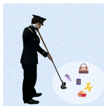
マジックハンド体験

線路上の落とし物を拾う際に使用するマジックハンドを使った体験やこども用駅長制服の試着など、駅員の仕事を身近に感じられる様々な体験コンテンツを揃えています。またアンケートに回答をすると、オリジナルグッズがもらえるカプセルトイが回せます。