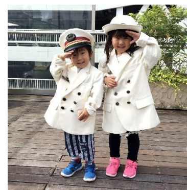
こども用駅長制服試着体験