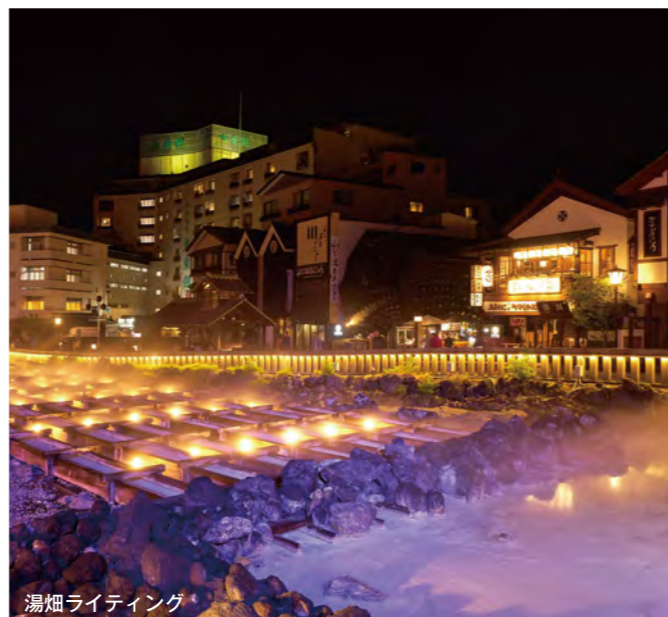
湯畑ライティング