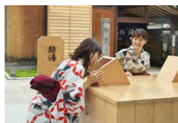
顔湯 湯畑近くの人気スポット「裏草津地蔵」エリアで温泉スチーム体験。源泉の上にセットされた木枠を取くと、やさしく顔を包む温泉ミスト。全国でもめずらしい「顔湯」。24時間無料。お気軽にどうぞ！ 【問】0279-88-0800 草津温泉観光協会 【交】長野原草津口駅からバス約25分+徒歩約5分