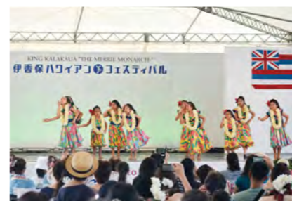
伊香保ハワイアンフェスティバル 世界最高峰のフランスの祭典「メリーモナークフェスティバル」実行委員会とハワイ島日系人協会協力のもと開催されるフランスの大会で、特設ステージや石段街などがフラ一色に。 【問】0279-72-3151 渋川伊香保温泉観光協会 【交】渋川駅からバス約25分