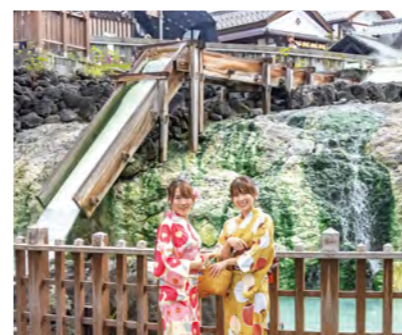
浴衣de散歩 風情あふれる草津の温泉街をのんびり散歩。浴衣姿で湯畑や路地を巡り、旅のひとつをより特別に彩ります。カラバリエーション豊富な色浴衣・飾り帯の中からお気に入りをどうぞ。 【問】0279-88-9000 御産之湯 【交】長野原草津口駅からバス約25分+徒歩約5分