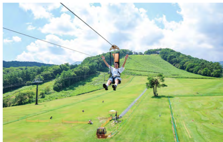
草津温泉BanZip TENGU 草津に生まれた豪快な空中アトラクション。標高約1,370mの天狗山山頂からふもとまで急勾配のワイヤーロープ全長約500mを一気に滑空！草津温泉街や山並みなどのパノラマが眼下に広がります。 【問】0279-88-8111 草津温泉スキー場 【交】長野原草津口駅からバス約25分+タクシー約5分