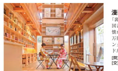
漫画堂 「裏草津地蔵」エリアに生まれた漫画図書館。本のぬくもりのある館内に、懐かしの名作から話題の新作まで1万冊余りの漫画本。テーブル席やカウンター席などでゆっくりと、レジェンドたちの直筆画にも出会えます。 【問】0279-88-4050 草津観光公社 【交】長野原草津口駅からバス約25分+徒歩約5分