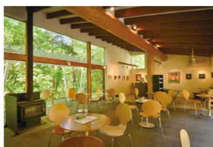
森のカフェIKSEKI 四万温泉入り口、四万川ほとりの森に囲まれたリゾートカフェ。すてきな空間でパティシエール監修のおしゃれなスイーツやオリジナルの軽食を。庭にはご利益があるとされる石のオブジェも。 【問】0279-64-2290 【交】中之条駅からバス約25分