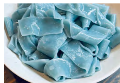
四万ブルーうどん 四万温泉街入り口に佇む「蒼水庵」。そこで提供している四万ブルーをイメージした鮮やかな青いうどんが話題のメニュー。ベースも醤油・味噌・豆乳から選べるのがうれしい。 【問】0279-62-9688 蒼水庵 【交】中之条駅からバス約30分