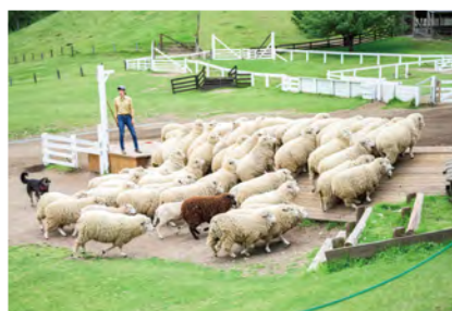
伊香保グリーン牧場 伊香保温泉近く、榛名山麓に広がる自然豊かな観光牧場。ヒツジ・ヤギ・ウサギなど動物たちとのふれあい、ポニー乗馬体験やバターづくり・アイスクリームづくり体験も。スケールの大きな「シブプロッグショー」もお楽しみ。 【問】0279-24-5335 【交】渋川駅からバス約15分