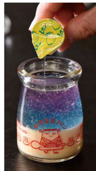
草津温泉プリン 素材にこだわり、ひとつひとつ工房で手作り。草津湯畑をイメージしたエメラルドグリーンの「湯畑プリン」、レモンポーションをかけたと色が変化する「夜の湯畑プリン」がユニーク。定番はなめらかとろける「湯もみプリン」！ 【問】0279-82-5278 【交】長野原草津口駅からバス約25分+徒歩約5分