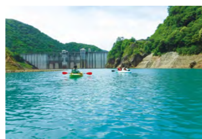
奥四万湖 グリーンディスカバリー 四万温泉の奥に広がる1周約4kmの人工湖。時間帯などで彩りを変える「四万ブルー」と呼ばれる神秘的な水の色。その奥四万湖でカヌーやカヤックなどを楽しみむひととき。新鮮な「湖上の目録」で夏の湖と溶け合う体験を！ 【問】0279-56-3999 【交】中之条駅からバス約40分。バス終点から徒歩約50分またはレンタサイクル約20分