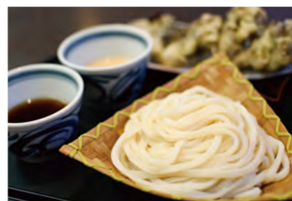
水沢うどん 讃岐うどん・桶庭うどんと並ぶ日本三大うどんの一つといわれ、なかでも戦国時代にさかのぼる歴史は最古。ツルッとしてコシがある、夏こそ際立つおいしさ！榛名山麓、伊香保へ続く道にお店が並ぶ「水沢うどん街道」へ！ 【問】0279-72-3588 しづかわ商工会伊香保支所