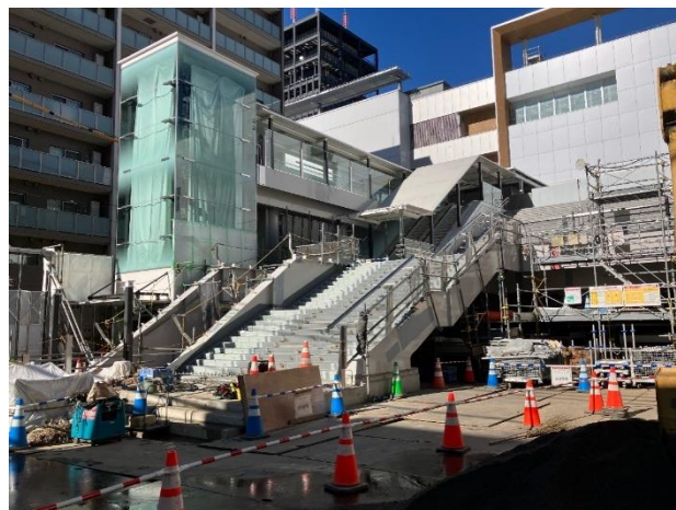
【駅南側デッキ工事（UR 施行）2025年12月撮影】