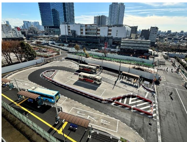
【駅北側仮設バスロータリー（UR 施行）2025年11月撮影】