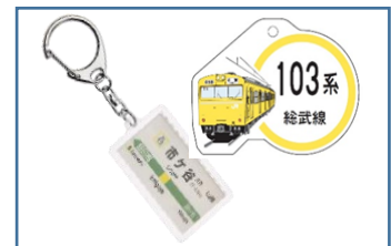
鉄道グッズイメージ

「都区版鉄道トレジャーハンター」の開催期間中、市ヶ谷駅のNewDaysで鉄道グッズを販売します。ご参加の記念にぜひお買い求めください。