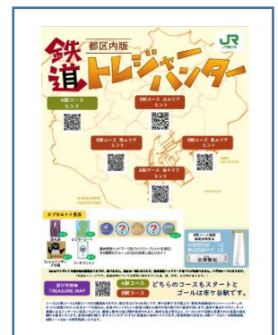
専用キットイメージ

※エキトマチチケットとは、ECサイト「JRE MALL」にてご購入いただける電子チケットです(1枚500円)。