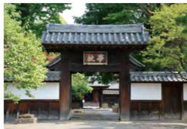
史跡足利学校 日本で最も古い学校跡として、大正10年に国の史跡に指定され、平成27年には「日本遺産」に認定。自由で開放的な学びと自学自習の精神は、近世の学校の原点となっています。 [問]0284-41-2655 [交]足利駅から徒歩約10分