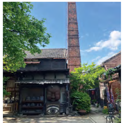
七ツ梅酒造跡 七ツ梅酒造は元禄7年(1694)創業の深谷の蔵元。跡地を利用し、古い建造物を映画館・カフェ・古書店などに活用。広い敷地に入ると異世界に迷い込んだかのような、ドラマや映画のロケ地になっています。 [問]048-573-8707 [交]深谷駅から徒歩約10分