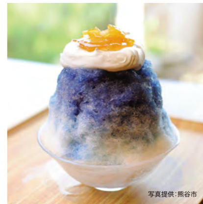
雪くま 熊谷のまちおこしでブランド化したかき氷。地元の水を使った氷、雪のようなふわふわ感、オリジナルシロップの3つが条件。各店それぞれユニーク、種類はさまざま。ひんやり、食べ比べてみては? [問]048-524-1111 熊谷市商業観光課 [交]各店舗により異なります