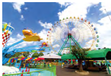
Auto Mirai 華蔵寺遊園地 広場・遊園地・野球場、陸上競技場などが集まる総合公園。遊園地は入園無料で、伊勢崎市のほぼ全域から見える高さ約65mの大観覧車「ひまわり」がシンボル。 [問]0270-25-4478 [交]伊勢崎駅から徒歩約10分