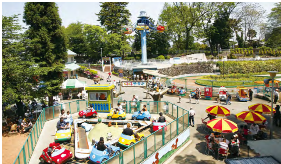
るなばあく 1954年開園のノスタルジックな遊園地。入園無料、小型遊具10円、大型遊具50円。文化財の電動木馬(10円)は子どもに人気。園内におむすびカフェや日替わりキッチンカーも。 [問]027-231-6774 [交]前橋駅からバス約10分

両毛線は、もともと沿線一帯でつくられていた生糸や織物を輸送するために建設されました。織物の産地として「織姫町」「足利織姫神社」などゆかしさを伝える桐生・足利、生糸の市(いとのみち)として栄えた前橋、そして伊勢崎銘仙で知られる伊勢崎など、シルクでつながる両毛線沿線を巡る旅。佐野や栃木などを含めて、駅からまち歩きできるのも魅力。日本最古の学校といわれる「史跡足利学校」、明治時代の迎賓館・貴賓館として建てられた前橋の「臨江閣」など、歴史遺産も豊か。そして両毛線の夏といえば「桐生八木節まつり」の季節。郷土の誇りを守り伝えてきた人たちの心意気を感じながら、ノスタルジックな夏の旅へ。沿線に展開する、素朴でちょっとレトロな遊園地にもご家族でどうぞ。