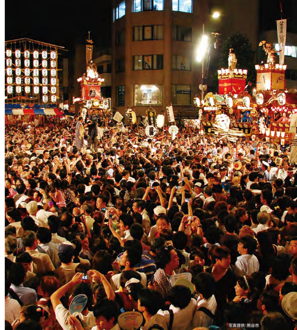
熊谷うちわ祭 江戸時代から続く八坂神社例大祭。12台の山車・屋台が繰り出す豪華さは「関東一の祇園」とも。お囃子を競う「叩き合い」は迫力満点! [問]048-524-1111 熊谷市商業観光課 [交]熊谷駅から徒歩すぐ