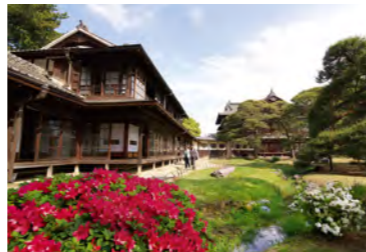
臨江閣 明治時代に建てられた近代和風の木造建築。本館・別館・茶室から構成されています。日本庭園と調和した落ち着いたたたずまいが魅力。国指定重要文化財。 [問]027-231-5792 [交]前橋駅からバス約10分