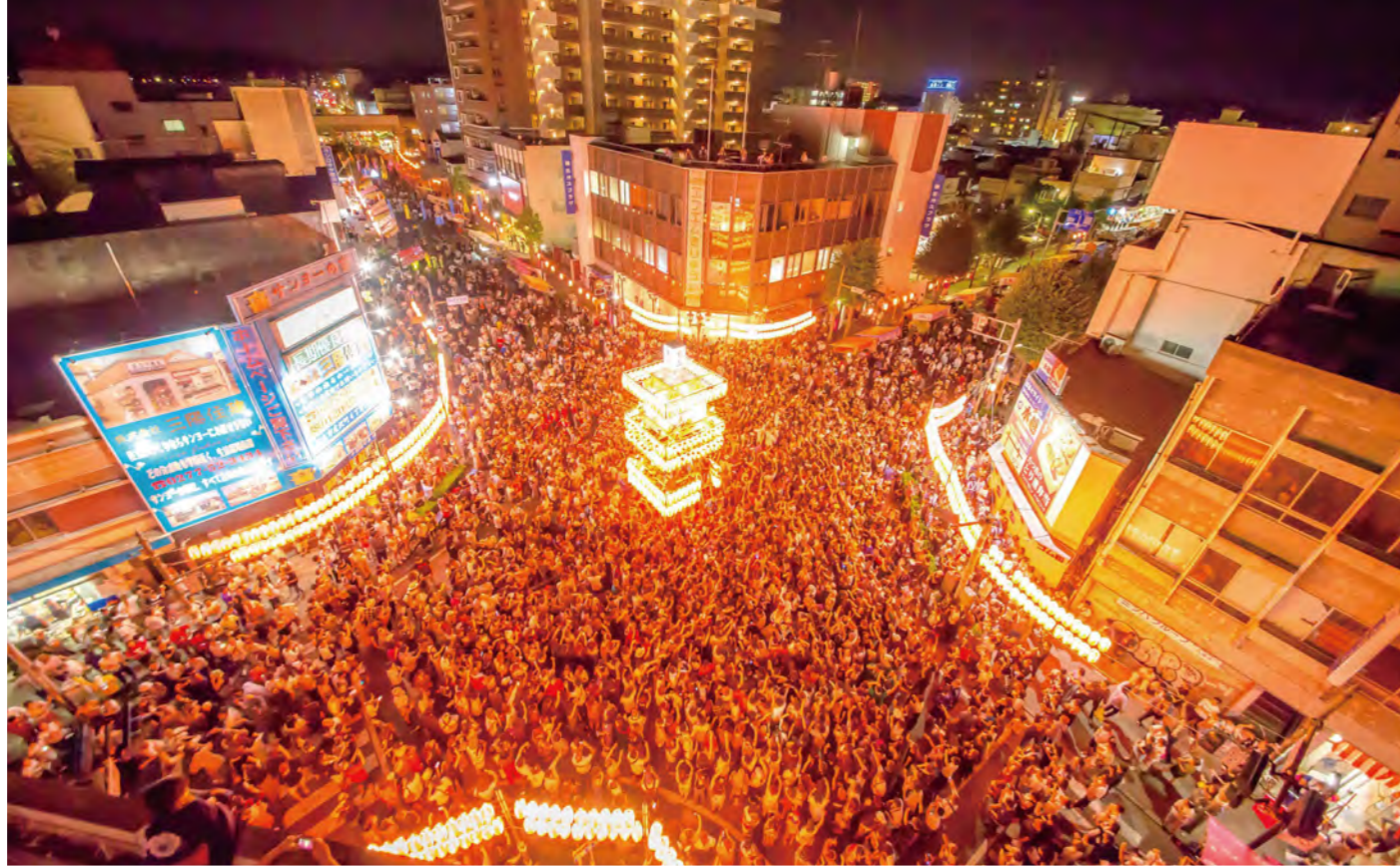
桐生八木節まつり 両毛線沿線最大規模の夏祭り。例年50万人以上の入出。祇園屋台や鉦の巡行など。本町五丁目交差点の大櫓が名物。踊りの輪が何重にも広がり、熱気に包まれます。まさに真夏の祭典！ [問]0277-46-1111 桐生市観光交流課 [交]桐生駅から徒歩すぐ