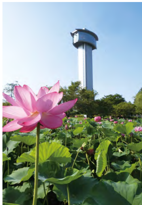
古代蓮の里 行田市の花、天然記念物「古代蓮(行田蓮)」をシンボルとする市民公園。園内にそびえる高さ約50mの展望タワーがランドマーク。展望タワーから望む「田んぼアート」は7月頃~10月頃が見頃!約40種の蓮の花は例年6月中旬から8月上旬の早朝が見頃! [問]048-559-0770 [交]行田駅からバス約20分

「あついぞ!熊谷」で全国に知られた熊谷市。2018年7月23日に国内観測史上最高気温41.1度を記録(2年後の2020年に浜松市で同じ気温が観測され、現在1位タイ)。気温の高さでヒートアップするのではなく、ミストシャワーやまちなかオアシスなど「暑さ対策日本一の推進」をキャッチフレーズに掲げて取り組んでいる。市民の熱い気持ちを盛り上げる「熊谷うちわ祭」、実施店舗ごとに工夫を凝らした「雪くま」も好評!ご当地グルメや自然、歴史、文化を堪能しながら、埼玉県北部へぐるっと涼旅(良旅)を!