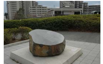
『雨のステーション』の歌碑

なお、『雨のステーション』の歌碑が国営昭和記念公園（西立川口）に建立されております。（平成14年10月）