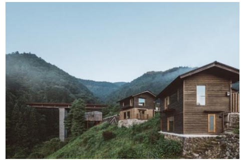
～700人の村が一つのホテルに～小菅村「崖の家」