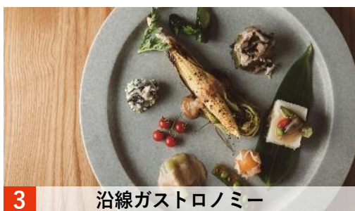
3 沿線ガストロノミー

チェックイン後、送迎車で宿泊地に移る道中、幾つかの集落をホッピングしながら、沿線まるごとホテルならではのマイクロツーリズムを楽しんで頂きます。今回のプランでは、駅周辺の「白丸集落」で多摩川の景観や旧道の史跡を楽しんで頂いた後、車窓の緑が美しい「むかし道」を車で進みながら、「境集落」に立ち寄り、湧き水、ワサビ田、神社などをご案内します。