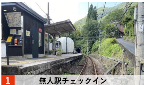
1 無人駅チェックイン

「沿線まるごとホテル」の体験・宿泊プラン「無人駅からはじまる、源流への旅」では、以下の4つの体験コンテンツをご用意・ご提供します。