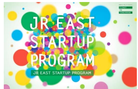
JR 東日本スタートアッププログラム